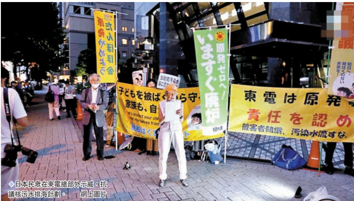
日本民眾在東電總部外示威，抗議核污水排海計劃。

日本《東京新聞》周四發表評論文章，稱日本政府強行將核污水排海，令日本漁業人員、消費群體乃至國際社會的不安情緒加劇，IAEA的報告不應成為強推核污水的「護身符」，日本漁業人員、消費群體以及國際社會的理解不可或缺，強行排海將給日本埋下禍根。