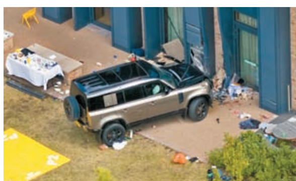
涉事汽車停在校外。網上圖片

倫敦警方表示，於早上近10時接報，一輛越野路華汽車撞入位於坎普路的The Study Preparatory School。據報該學校專門供4歲至11歲女生入讀，當時有一班師生於學期最後一天，在戶外參加茶會。